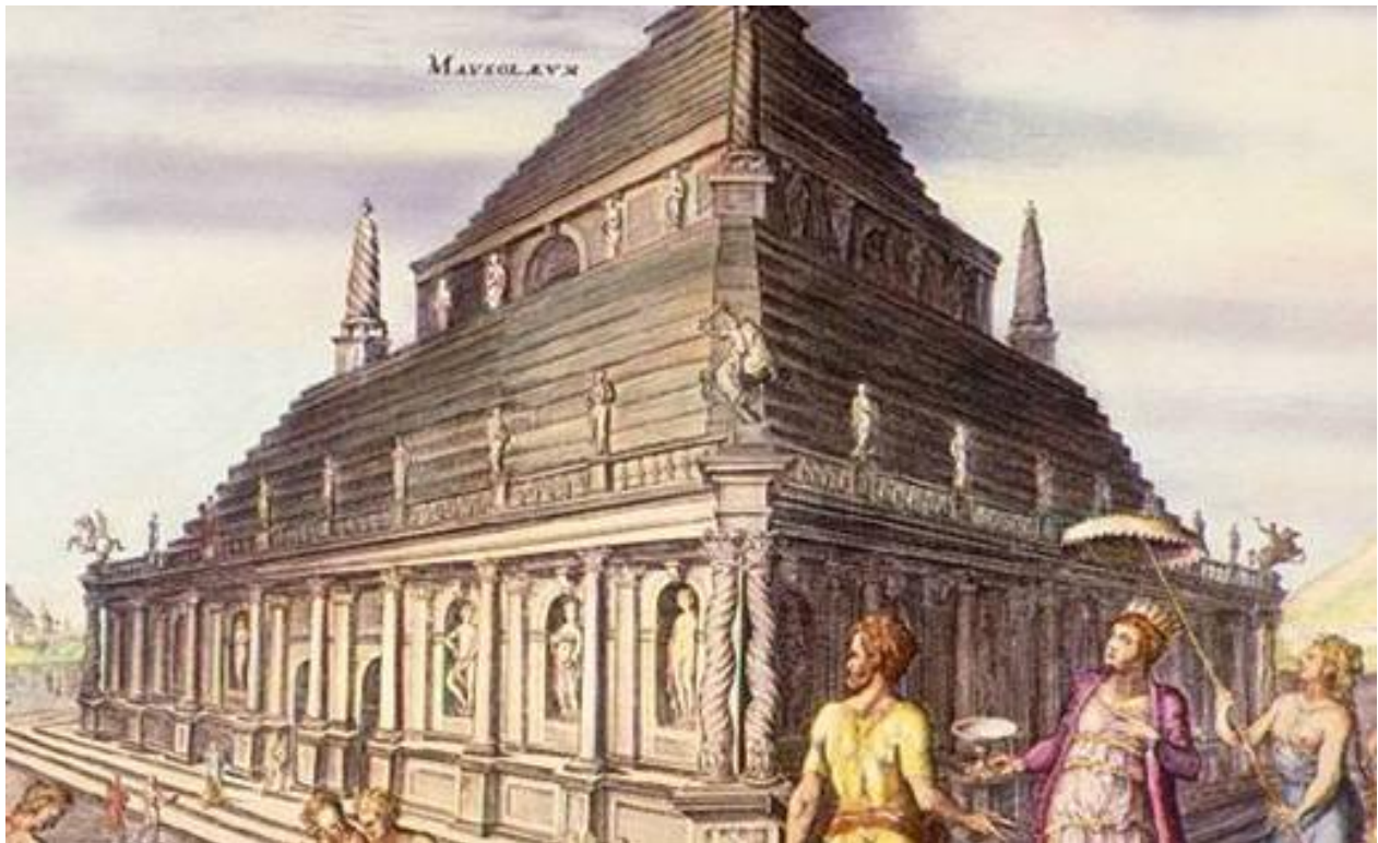
Маузолеј у Халикарнасу Мермерна гробница саграђена у Малој Азији у 4.в.п.н.е.