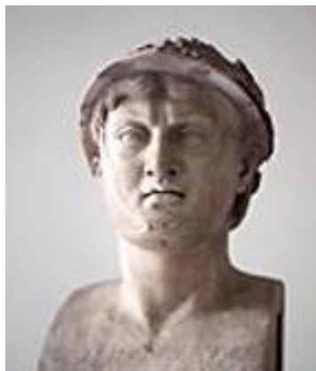
Пир, краљ Епира

Грчка богиња мудрости, Зевсова кћер. Најмоћнија грчка богиња. Посвећен јој је храм на Акропољу. Ова статуа атине налази се у националном музеју у Напуљу.