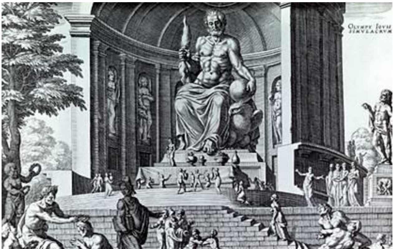
Зевсова статуа у Олимпији Направио ју је грчки вајар Фидија око 435.г.п.н.е. Била је висока 12 метара и налазила се у Олимпији. Одећа и украси направљени су од злата, а тело од слоноваче.